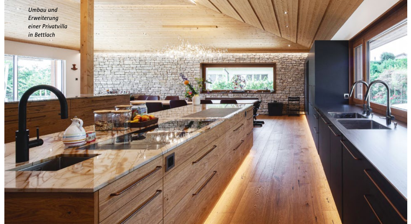
Umbau und Erweiterung einer Privatvilla in Bettlach