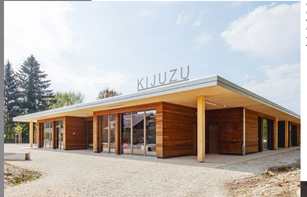
Neubau KIJUZU am Wald Kinder- und Jugendzentrum Zuchwil