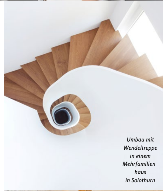
Umbau mit Wendeltreppe in einem Mehrfamilienhaus in Solothurn